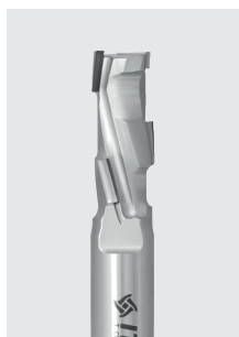
DIA stopková fréza Z1+1 řada DTA