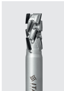
DIA stopková fréza Z3+3+1 Nesting řada DTM