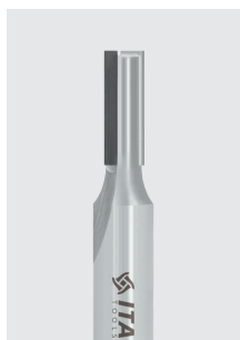
DIA stopková fréza Z2 řada DT2 negativní