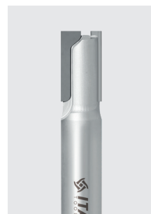
DIA stopková fréza Z2+1 řada DTS pozitivně-negativní