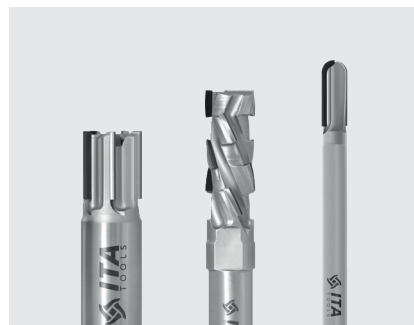
DIA frézy do kompozitů

Nestandardní nástroje lze vyrobit na vyžádání.