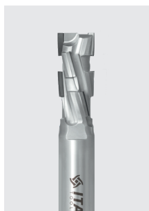
DIA stopková fréza Z2+1 řada DTN