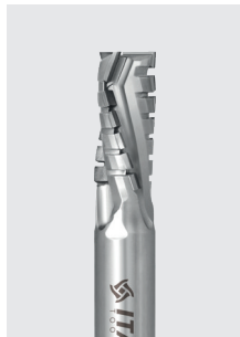
DIA stopková fréza Z3+1 TURBO řada DTE