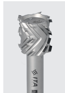
DIA stopková fréza Z3+3 ořezávací řada DTJ