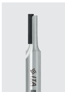
DIA stopková fréza Z1 řada DT1 negativní