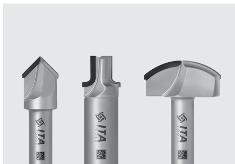
DIA profilové frézy